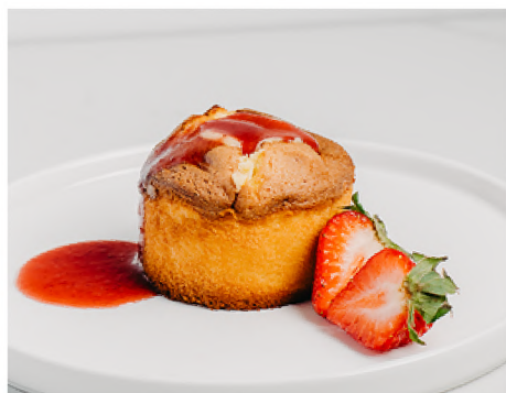
MI-CUIT FRAISES & CHOCOLAT BLANC

160G/PORTION 20 PORTIONS/BOÎTE 1 BOÎTE/CAISSE