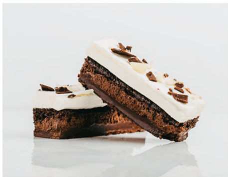
LANGUETTE TROIS CHOCOLATS