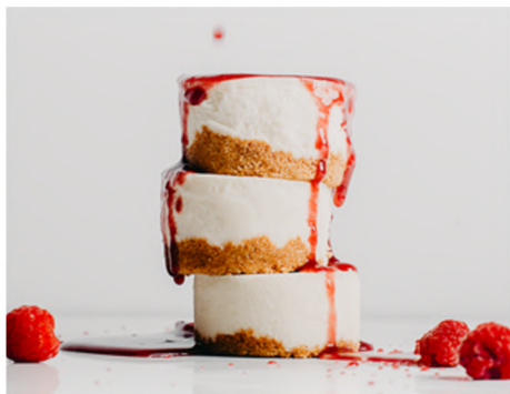
MIGNON AU FROMAGE NEW YORK