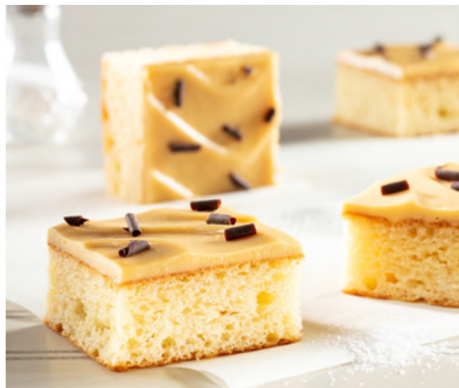
AVANTAGEUX CARMEL SALÉ