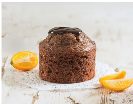
PETIT LAVA CHOCOLAT

120G/PORTION 20 PORTIONS/BOÎTE 1 BOÎTE/CAISSE