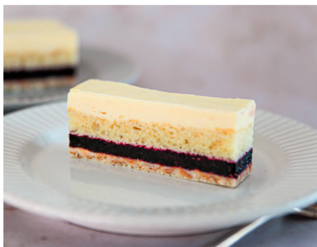
LANGUETTE CAMERISE & MASCARPONE

70G/PORCION 48 PORTIONS/BOÎTE 1 BOÎTE/CAISSE